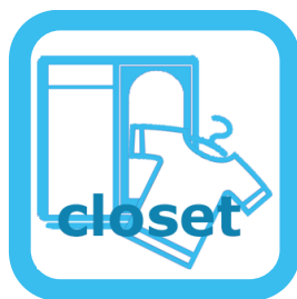
クローゼットのニオイ