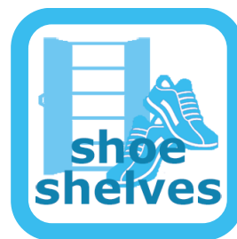
シューズボックスのニオイ